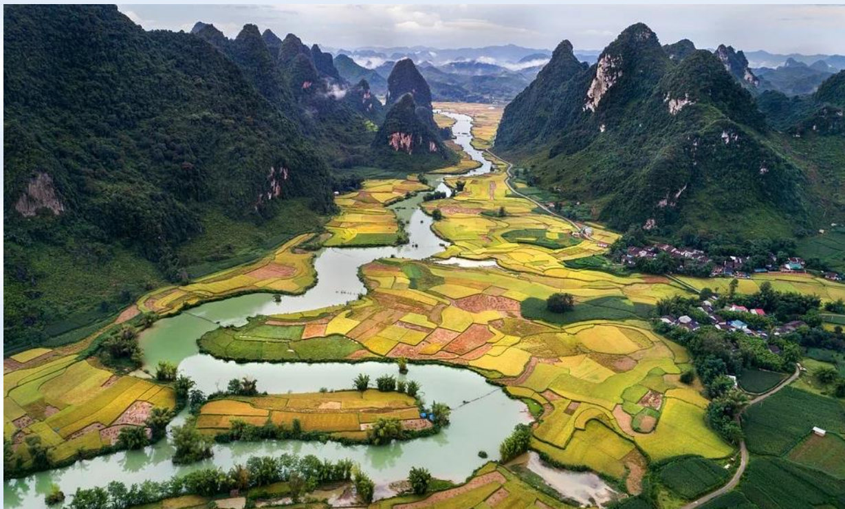
יום 5: 17.05, - האנוי – סאפה- הר פאניספאן FANSIPAN - רכבל

לאחר ארוחת הבוקר, נעלה על חשמלית שלוקחת אותנו ממרכז סאפה דרך עמק Muong Hoa כדי להגיע לתחנת הרכבל. לאחר מכן, נבקר בהר פאניסיפן ברכבל. לידיעה, הרכבל בסאפה הוא הרכבל הארוך והגבוה בעולם, העולה מהעיירה סאפה המנומנמת במחוז לאו קאי אל פסגת הר פאניסיפן בגובה 3,143 מטר, הידוע כגג הודו. נהנה מהנוף מהנקודה הגבוהה ביותר של ההר המדהים הזה. הצמחייה הירוקה והסובטרופית הופכת את ההר הזה ליפה מאוד. נצלם כמה תמונות לחוויה בלתי נשכחת מלמעלה. לאחר שתצפת על הנוף אז נעלה ברכבל חזרה לסאפה. אחר הצהריים: נסיעה חזרה להאנוי. בדרך נעצור בשער הגבול בין וייטנאם לסין. לאחר מכן נמשיך בחזרה להאנוי. לינה במלון בהאנוי.